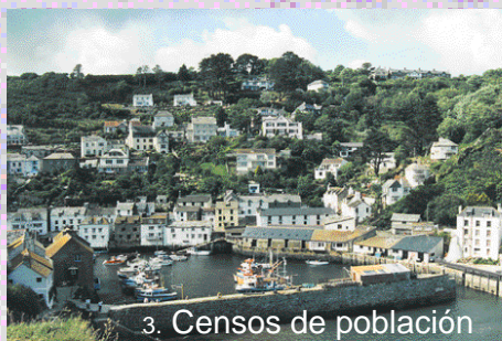
3. Censos de población