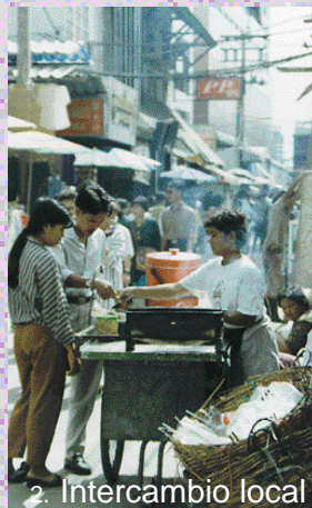
2. Intercambio local