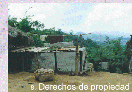
8. Derechos de propiedad