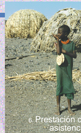
6. Prestación de asistencia