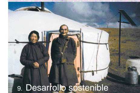
9. Desarrollo sostenible