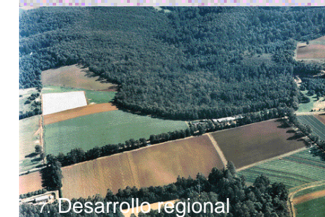
7. Desarrollo regional