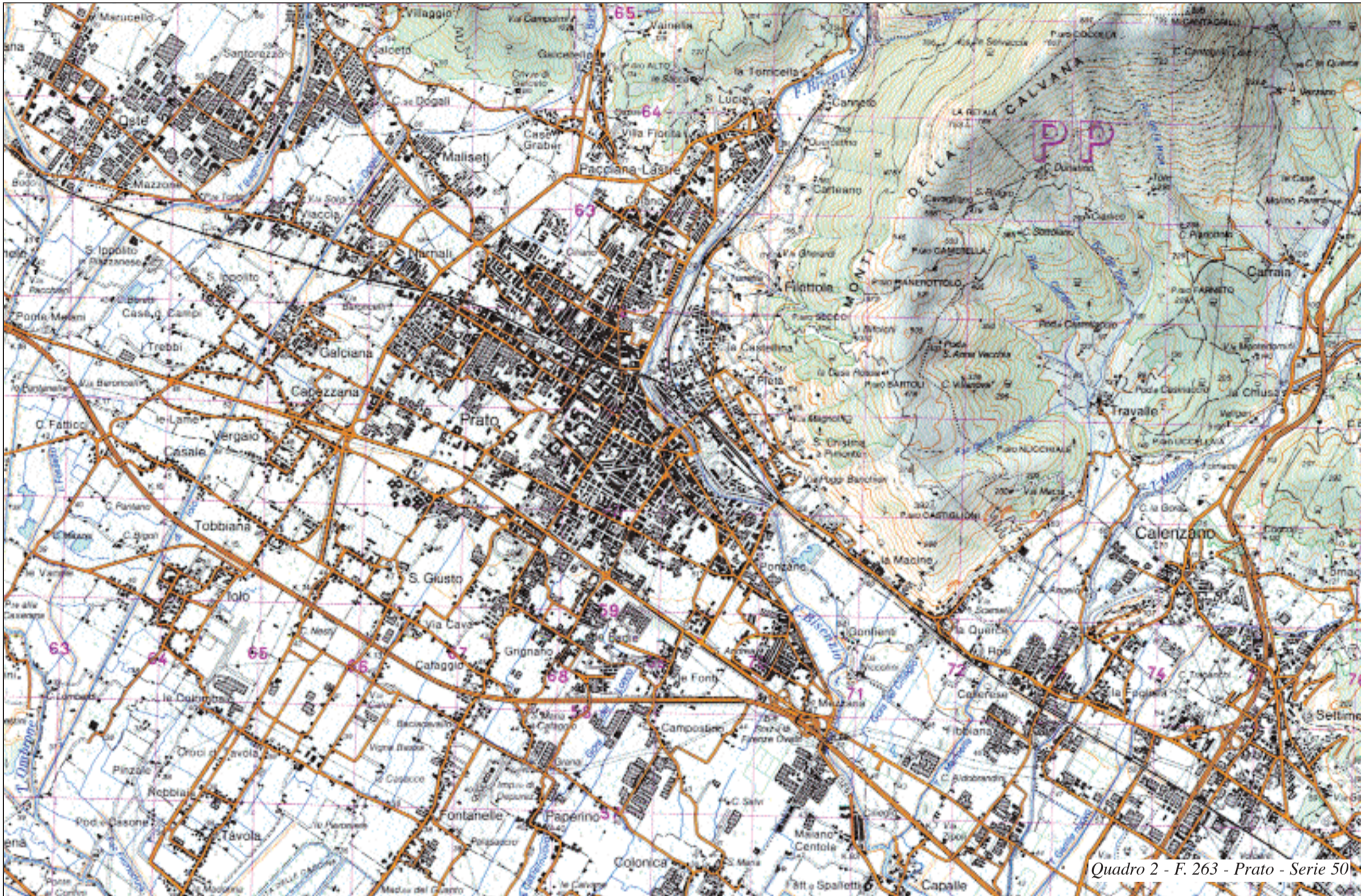
Quadro 2 - F. 263 - Prato - Serie 50