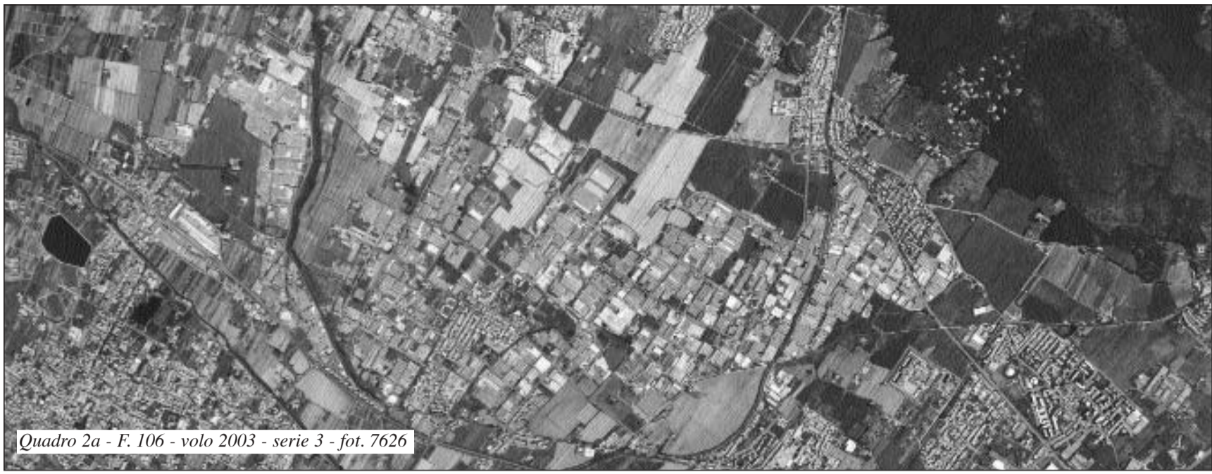
Quadro 2a - F. 106 - volo 2003 - serie 3 - fot. 7626