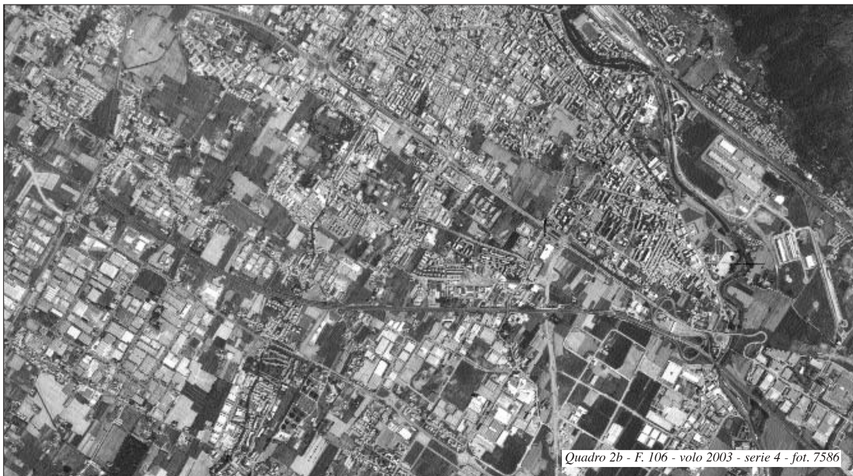
Quadro 2b - F. 106 - volo 2003 - serie 4 - fot. 7586