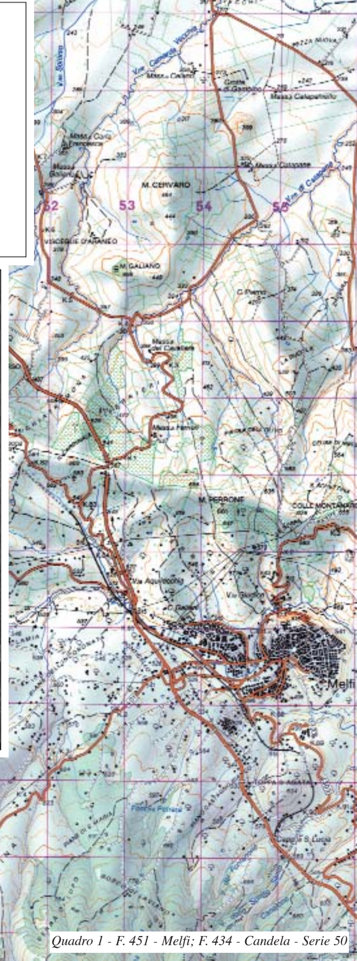
Quadro 1 - F. 451 - Melfi; F. 434 - Candela - Serie 50