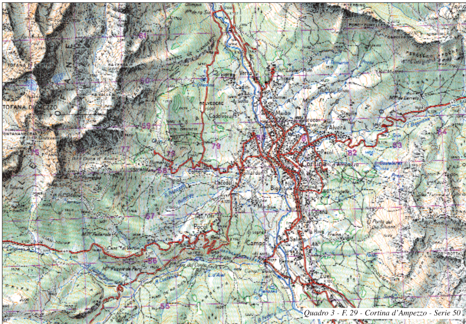
Quadro 3 - F. 29 - Cortina d'Ampezzo - Serie 50

Sebbene cinquant'anni fa Cortina d'Ampezzo disponesse solo di quattro impianti di risalita, dopo gli incrementi dei primi anni '70, ha assistito ad una notevole espansione degli stessi, tanto che oggi nella sua conca emergono una ventina di installazioni, fra quali varie seggiovie e sciovie. Com'è facile constatare, permane tuttora il problema della separazione delle aree sciabili del versante orientale (Falòria - Cristallo) rispetto a quelle del versante occidentale (Pocòl - Tofàne), diversamente da quello che accade per il massiccio