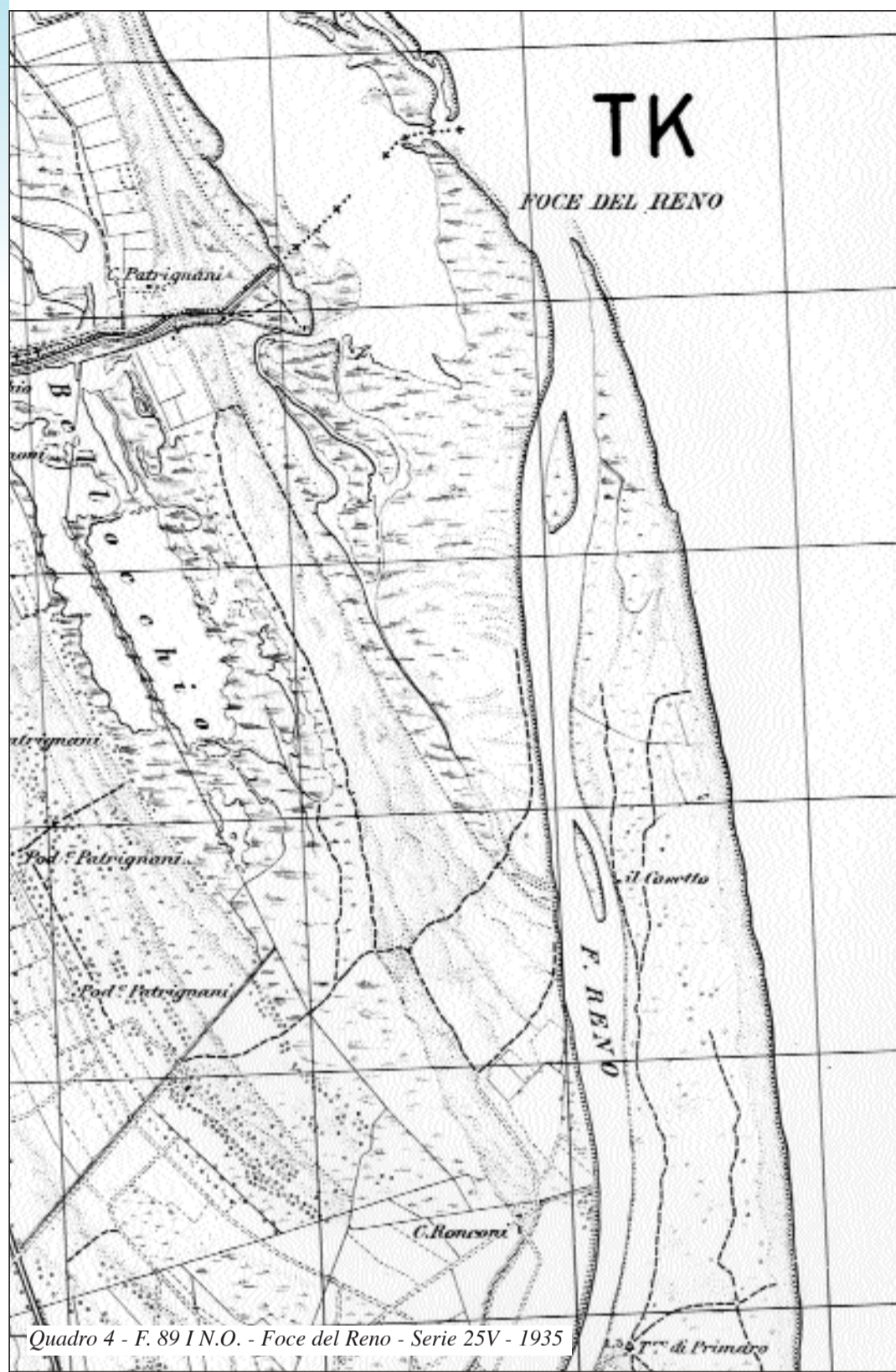
Quadro 4 - F. 89 I N.O. - Foce del Reno - Serie 25V - 1935

In ambito nazionale la foce del fiume Magra ( quadro 1 ) è quella che meglio suggerisce una conformazione ad estuario, anche se, nel recente passato, le geometrie delle batimetriche mostravano un embrionale delta sommerso. Inoltre, la differente conformazione morfologica delle sponde, che delimitano la foce, rende peculiare questo corso d'acqua: quella destra è costituita da un rilievo montuoso, mentre l'altra, protesa artificialmente verso il mare per la costruzione di un molo, corrisponde ad una pianura alluvionale bordata da spiagge sabbiose.