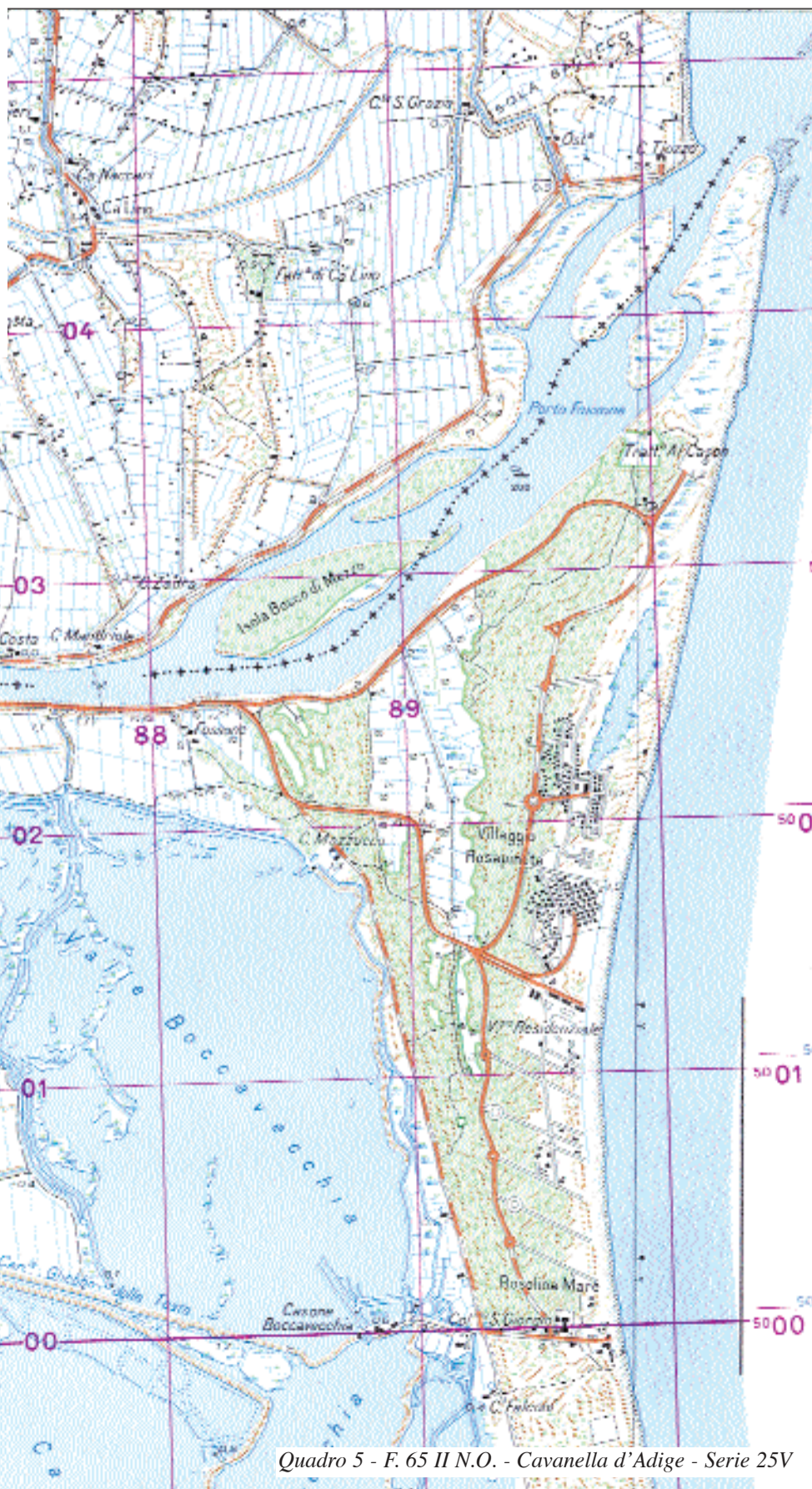
Quadro 5 - F. 65 II N.O. - Cavanella d'Adige - Serie 25V

Nel caso del fiume Reno, la progressiva rotazione e crescita della foce verso nord hanno favorito il formarsi di banchi sabbiosi ed isole ( quadro 3 ). La loro rapida crescita, determinata dagli ingenti apporti solidi portati a mare dal fiume e provenienti dallo smantellamento del vecchio apparato di