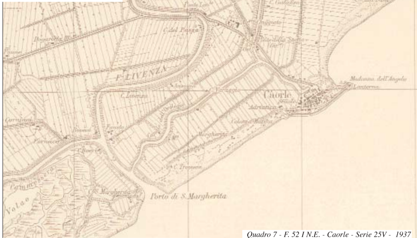
Quadro 7 - F. 52 I N.E. - Caorle - Serie 25V - 1937

La pesante riduzione delle portate solide dei fiumi avvenuta nell'ultimo secolo, oltre ad inibire lo sviluppo di questi sistemi di barre, ban-