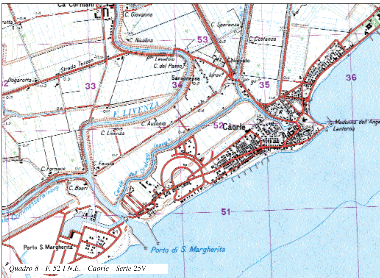
Quadro 8 - F. 52 I N.E. - Caorle - Serie 25V

chi, isole e cordoni litorali, ha determinato un generale arretramento e rettifica delle cuspidi focali. I sintomi di questa tendenza erosiva sono ben evidenti nel lobo destro della foce dell'Adige (quadro 5), caratterizzato da una ristretta estensione della spiaggia, da cordoni dunari interrotti da numerosi varchi e da un ampio territorio periodicamente sommerso dalle acque. Lo smantellamento dell'apparato di foce da parte del mare è favorito dall'azione erosiva della corrente fluviale che, in prossimità di Porto Fossone, ha dato origine ad una ben sviluppata ansa. La contemporanea erosione fluviale e marina riduce progressivamente l'ampiezza del cordone litorale che, qualora non si realizzino interventi di difesa, potrà determinare il taglio del lobo destro e lo spostamento a meridione della foce.