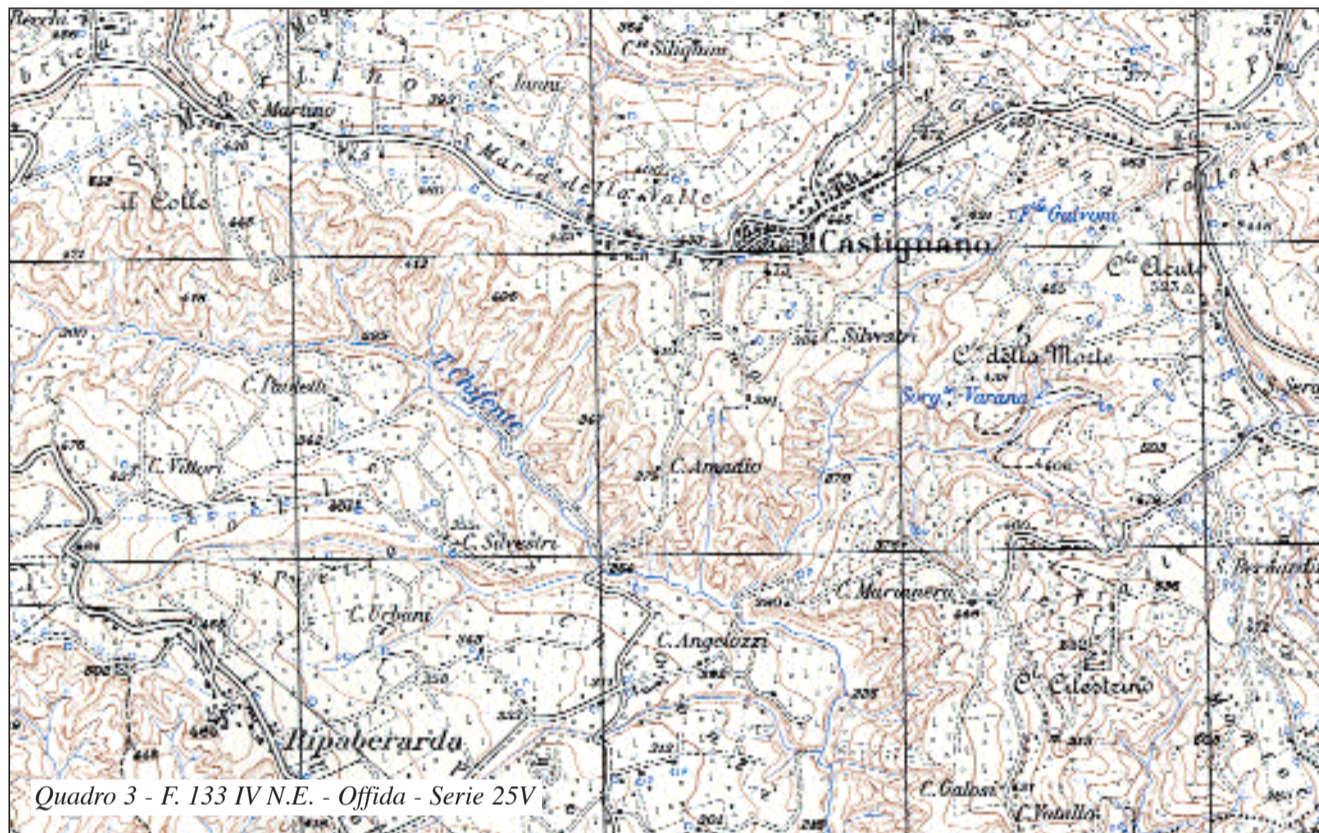
Quadro 3 - F. 133 IV N.E. - Offida - Serie 25V