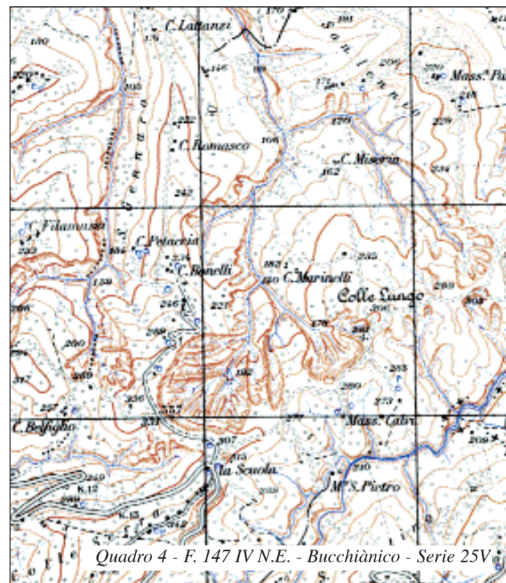
Quadro 4 - F. 147 IV N.E. - Bucchianico - Serie 25V