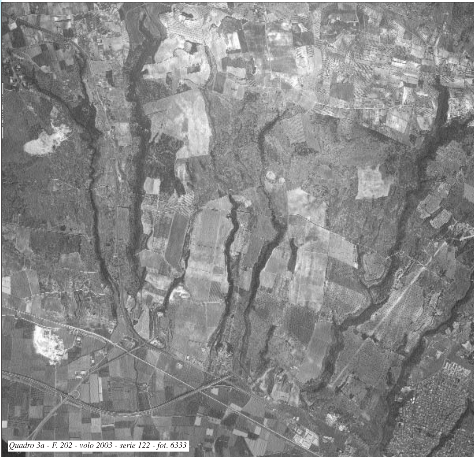
Quadro 3a - F. 202 - volo 2003 - serie 122 - fot. 6333