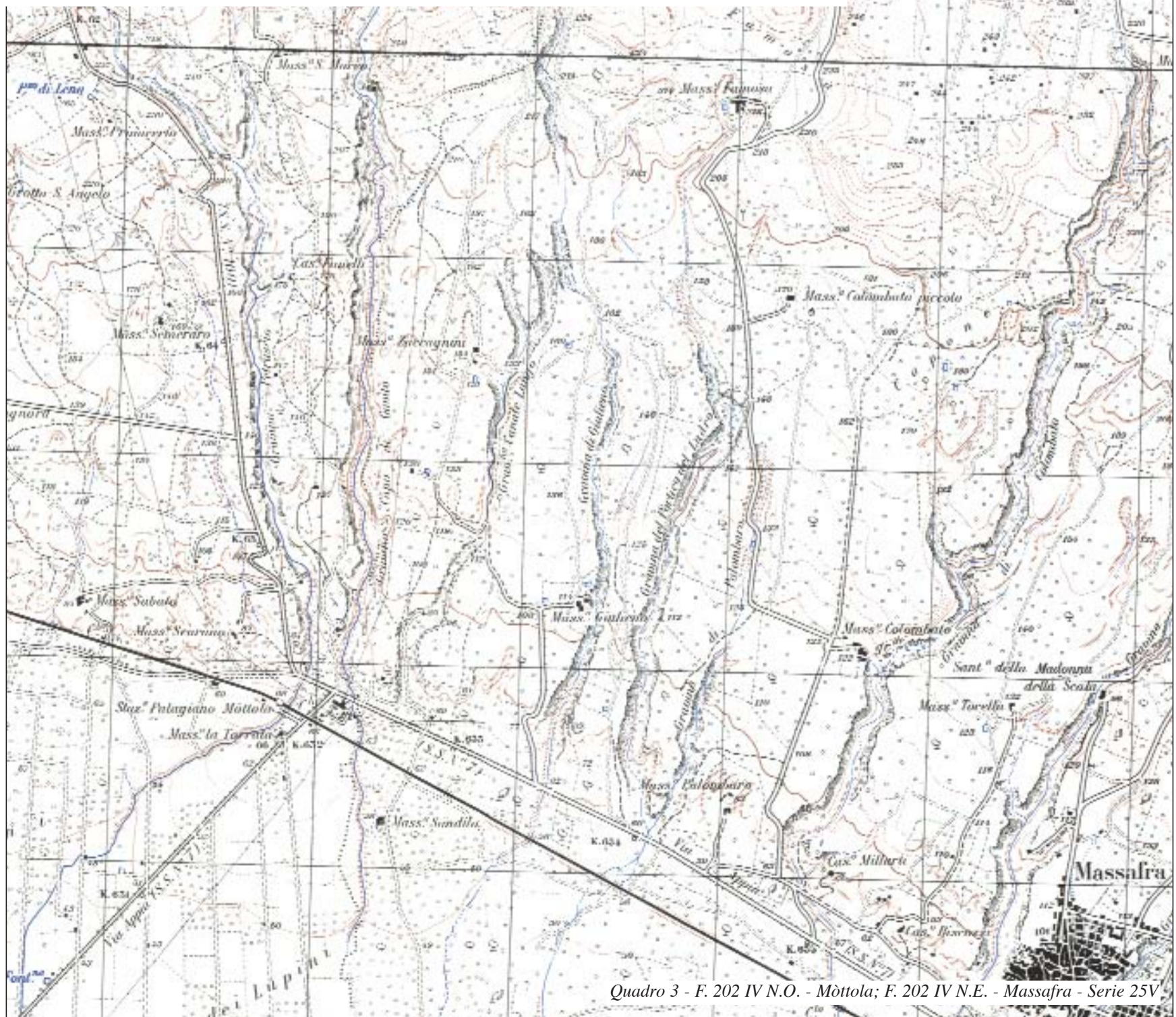
Quadro 3 - F. 202 IV N.O. - Mottola; F. 202 IV N.E. - Massafra - Serie 25V