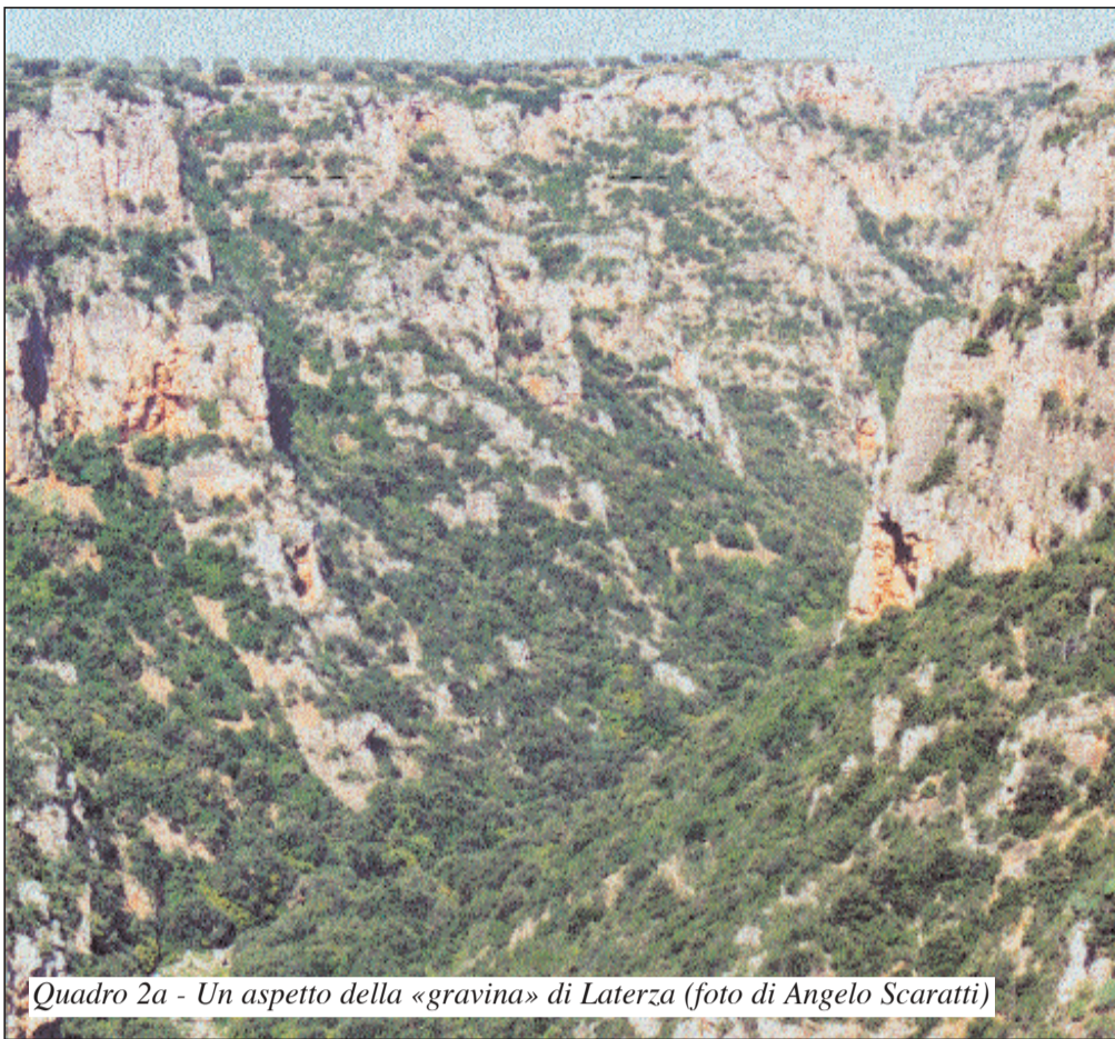
Quadro 2a - Un aspetto della «gravina» di Laterza

su quello destro, sugli affioramenti calcarenitici si sono sviluppate, nel corso dei secoli, soprattutto tra il Medioevo ed il XVIII secolo, varie forme di insediamenti ipogei, di cui i «Sassi» sono l'esempio più emblematico. Tali insediamenti, che utilizzano i terrazzi nonché cavità naturali ed artificiali, sono il risultato di uno stretto connubio tra le condizioni geomorfologiche dei luoghi e le esigenze economiche e sociali delle popolazioni.