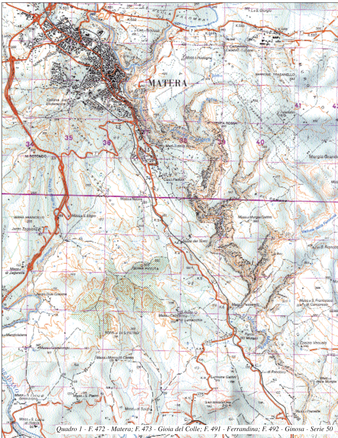
Quadro 1 - F. 472 - Matera; F. 473 - Gioia del Colle; F. 491 - Ferrandina; F. 492 - Ginosa - Serie 50

Pertanto sono stati presi in considerazione tre esempi di queste forme, che, a partire da NO, sono: la gravina di Matera, la gravina di Laterza e le gravine di Massafra.